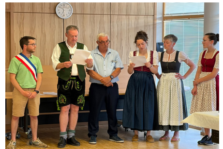
L'équipe municipale a reçu les Bavarois en Mairie le 27 mai

Début juillet, ce sont les jeunes Yffiniacais qui se rendront à Wackersberg pour un séjour qui sera tout aussi passionnant que celui que vient de vivre nos jeunes allemands !