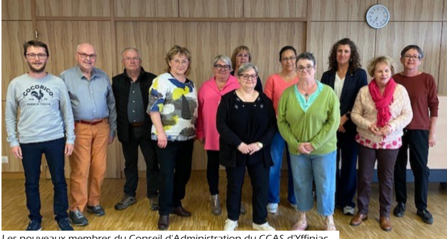
Les nouveaux membres du Conseil d'Administration du CCAS d'Yffiniac.

d'administration participe notamment à la définition des orientations et au suivi des actions menées en faveur des personnes âgées, des familles, des personnes en situation de précarité ou encore du maintien du lien social. Découvrez ci-dessous les membres du nouveau Conseil d'administration du CCAS d'Yffiniac.