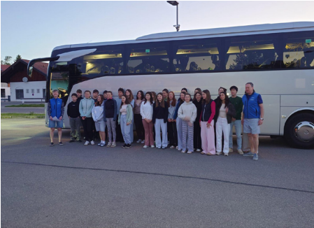
Les jeunes sont arrivés à Yffiniac le 24 mai