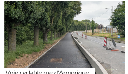
Voie cyclable rue d'Armorique

Le tronçon reliant la discothèque Le Thalys au rond-point de la Bourdinière est désormais achevé. La signalisation horizontale sera complétée par la réalisation de la peinture au sol prévue début juin. Cette nouvelle section a été conçue pour garantir la sécurité des usagers, puisqu'elle est entièrement séparée de la circulation automobile par un muret de protection. Ce nouvel aménagement s'inscrit dans un projet plus global visant à relier, à terme, la gare au centre-bourg. Pour finaliser cette liaison, deux phases supplémentaires seront programmées et réalisées en 2027.