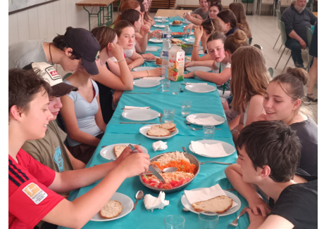
Les repas, des joyeux moments de partage !

L'association Bayrisch-Bretonischer Freundeskreis Wackersberg-Yffiniac e.v. , dans le cadre du jumelage avec le comité de jumelage et la Ville d'Yffiniac, a invité tous les jeunes de la commune de Wackersberg et des environs âgés de 13 à 16 ans à participer à un voyage en Bretagne du 24 au 31 mai.