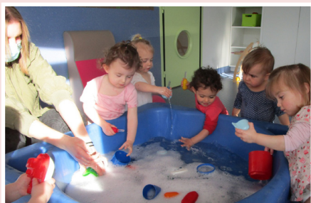
Des jeux d'eau permettent aux enfants de se rafraîchir

La fin du mois de mai a été particulièrement chaude, avec des températures qui ont dépassé les 30 degrés. À la crèche, les agents ont tout mis en œuvre pour que les tout-petits soient accueillis dans les meilleures conditions possibles afin de garantir leur bien-être et leur sécurité.