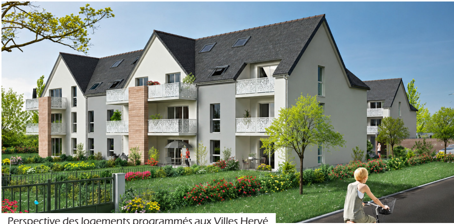
Perspective des logements programmés aux Villes Hervé

Le démarrage des travaux est envisagé pour fin 2026 ou début 2027, pour une durée estimée à 21 mois. Ce projet s'inscrit dans la volonté de la commune de proposer une offre de logements adaptée, durable et intégrée au cadre de vie local.