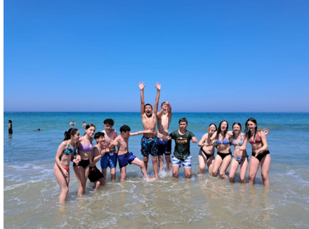
Certains jeunes ont vu la mer pour la première fois !