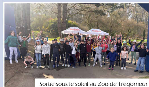
Sortie sous le soleil au Zoo de Trégomeur

En lien avec le thème de l'année axé sur le sport et le bien-être, c'est en tenue de course à pied que les élèves de CE1-CE2 et de CE2-CM1 se sont rendus au zooparc de Trégomeur le vendredi 20 mars.