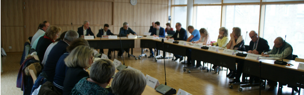
Le Conseil municipal d'installation a eu lieu le samedi 21 mars dans la Salle du Conseil municipal.