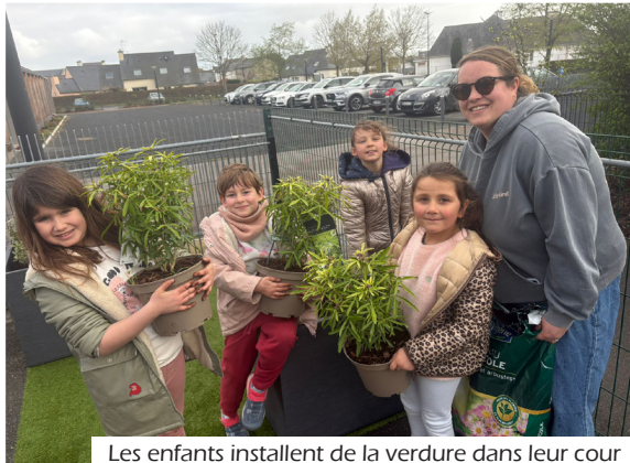
Les enfants installent de la verdure dans leur cour

de végétaux. Les objectifs: aménager des espaces conviviaux pour les enfants et offrir un espace plus accueillant pour les familles fréquentant le service.