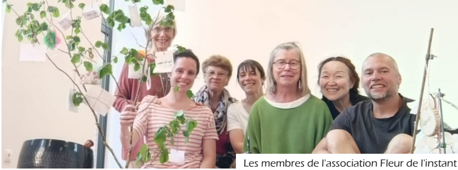
Les membres de l'association Fleur de l'instant

L'association Fleur de l'Instant propose des initiations et des ateliers de pratique régulière du "Zen". Elle organise un concert ouvert à tous le 17 avril.