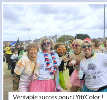
Véritable succès pour l'Yffi'Color !

Enfin, une bonne nouvelle pour l'école, avec l'ouverture de la troisième classe de la filière bilingue, et ce dès la rentrée de septembre !