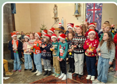
Les enfants de Saint-Aubin ont chanté Noël à l'église

Les élèves étaient fin prêts en cette veille de vacances pour présenter le fruit de leur travail aux familles. Initialement prévue sur la cour de l'école, la représentation a été accueillie à l'église pour échapper aux averses.