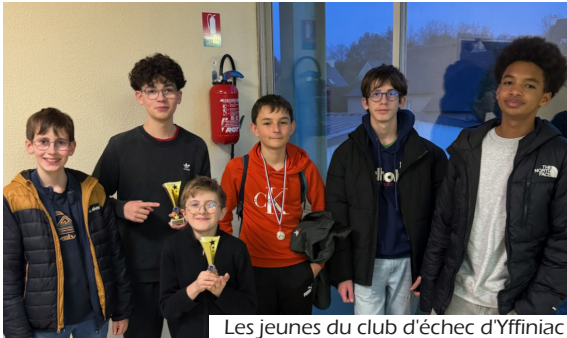
Les jeunes du club d'échec d'Yffiniac

Animé exclusivement par des bénévoles passionnés, le Club d'échecs d'Yffiniac rassemble aujourd'hui près de 40 adhérents, de tous âges et de tous niveaux.