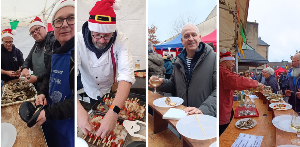
Nos élus et leurs conjoints(es) vous ont encore régalé cette année sur le marché ambiance Noël du 21 décembre dernier. La dégustation d'huîtres et de Saint-Jacques a été appréciée des gourmets.