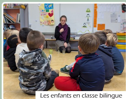
Les enfants en classe bilingue

Degemer mat e skol Simone Veil ! * À l'école publique, deux langues se côtoient au quotidien : le français et le breton. Les classes bilingues rencontrent de plus en plus de succès et séduisent de plus en plus de parents.