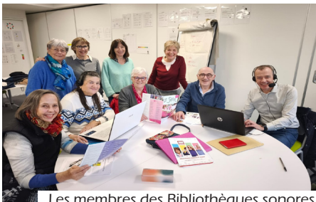
Les membres des Bibliothèques sonores

Ce sont des donneurs de voix, mais aussi des donneurs de temps. Les bénévoles des bibliothèques sonores de l'association des donneurs de voix ont comme objectif de promouvoir l'accès à la culture et à l'information pour tous, notamment pour des personnes atteintes de déficiences sensorielles, physiques ou cognitives qui les empêchent de lire.