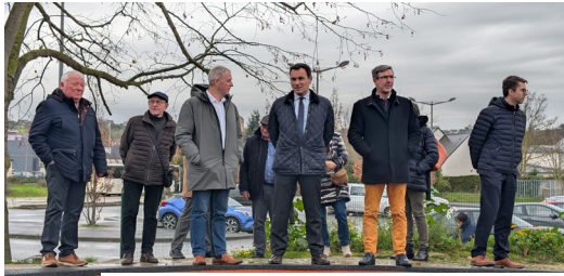
La délégation lors de la visite du pumptrack

La visite a également permis de présenter des projets et équipements structurants tels que l'îlot des Maisons d'Yffiniac, futur établissement dédié aux personnes atteintes de la maladie d'Alzheimer, l'école maternelle Simone Veil, prochainement engagée dans une rénovation énergétique, ou encore la