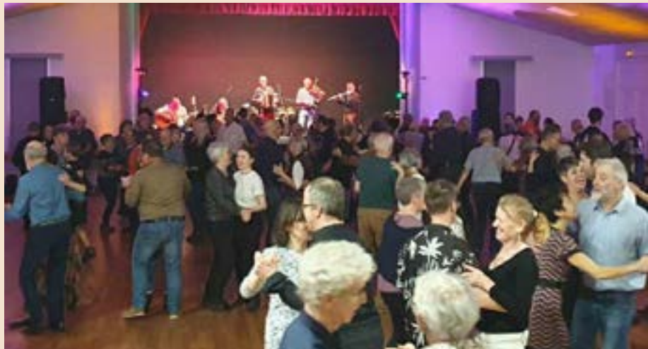
Le 3 février, l'Amicale Laïque organisait son fest-noz en lien avec la langue bretonne enseignée à l'école Simone Veil. Après une heure d'initiation, débutants et confirmés ont profité de la prestation des musiciens de Fest Noz Kemm Quintet & Joli Monde.