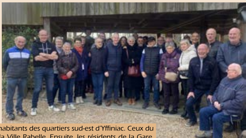
Le 17 février, deux rendez-vous étaient donnés par les élus aux habitants des quartiers sud-est d'Yffiniac. Ceux du quartier Pritel, Lande, Beussuet s'étaient donné rendez-vous à la Ville Rabelle. Ensuite, les résidents de la Gare, Mirouze et Blossiers se sont retrouvés sur le parking de la Gare. Chacun s'est exprimé sur les interrogations qu'il avait en matière d'urbanisme, de sécurité et d'autres sujets du quotidien. Ces rendez-vous permettent aussi de partager un temps convivial entre voisins et élus.