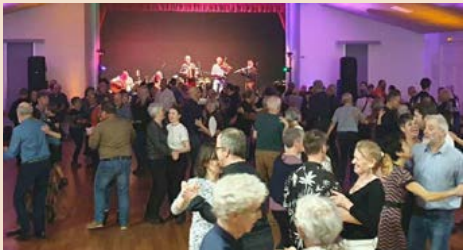
Le 3 février, l'Amicale Laïque organisait son fest-noz en lien avec la langue bretonne enseignée à l'école Simone Veil. Après une heure d'initiation, débutants et confirmés ont profité de la prestation des musiciens de Fest Noz Kemm Quintet & Joli Monde.