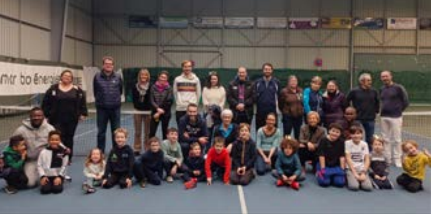
Surprises et sourires en ce jour de galette des rois et des reines au Tennis Club. Une soixantaine de personnes étaient présentes pour ce moment de convivialité. Un bel après-midi récréatif et gourmand partagé entre parents, enfants et membres du club. Le rendez-vous est déjà pris pour l'année prochaine !