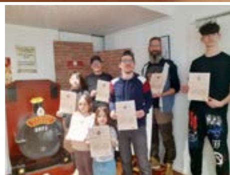
Sortez votre baguette ! Animation en famille avec à la clé, le brevet universel de sorcellerie élémentaire.