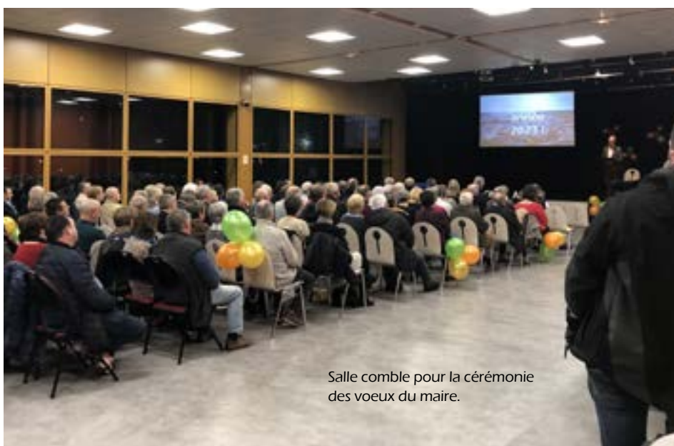
Salle comble pour la cérémonie des vœux du maire.

«...certains sont d'importance majeure, d'autres s'inscrivent dans notre quotidien ou en proximité de vie » poursuit-il. « La 1 ère mini-forêt, les enjeux autour de l'urbanisme et de l'aménagement du territoire, les loge-