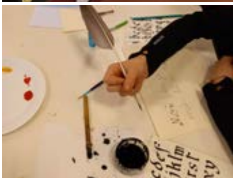
Atelier calligraphie du 14 décembre : les plus belles plumes étaient de sortie.