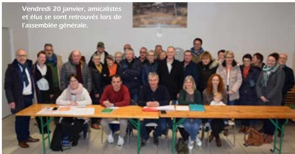
Vendredi 20 janvier, amicalistes et élus se sont retrouvés lors de l'assemblée générale.