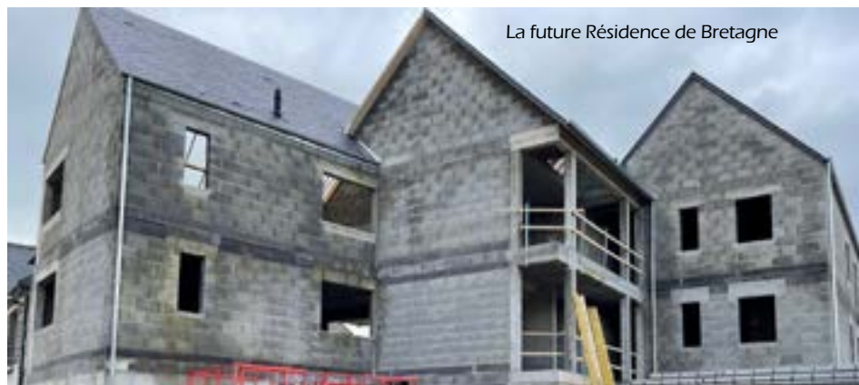
La future Résidence de Bretagne