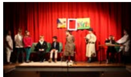
2017 - Les comédiens en herbe jouent la pièce Le mystère du tableau volé .

Vous souhaitez vous aussi jouer la comédie ? Alors n'hésitez pas à contacter Michaël Dagorn au 06 09 44 14 70.