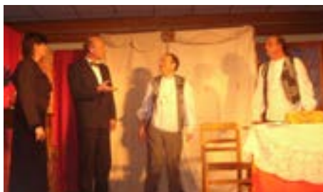
2008 - Les comédiens sont montés sur scène pour présenter la pièce L'affaire de la rue Lourcine .