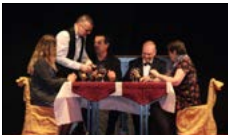
2018 - Les comédiens ont repris avec succès la pièce de Sacha Guitry, Désiré .

Tout ce petit monde vit des moments joyeux et des éclats... de rire bien entendu.