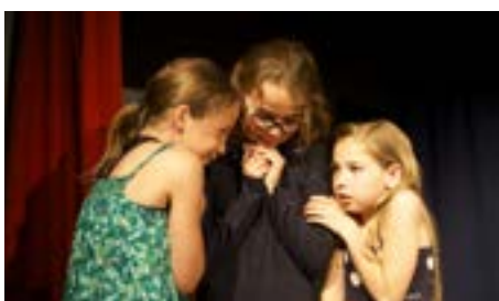
2017 - Une saynète intitulée Les Graspouniak interprétée par 3 jeunes comédiennes.