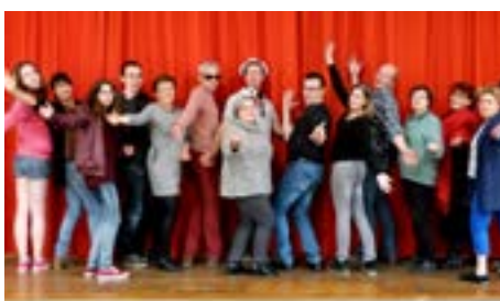
2017 - Lors d'une répétition pour L'esprit club , pièce écrite par la compagnie Quai Ouest.