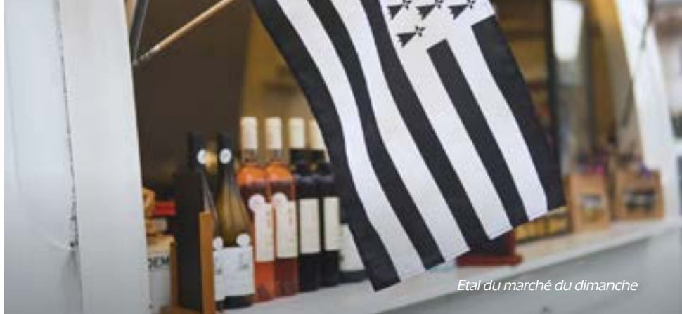
Etat du marché du dimanche

Pour tous renseignements, contacter la mairie au 02 96 72 60 33.