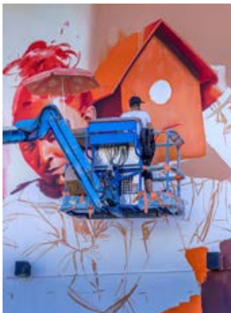
6 rue Julien Quintin - Auteur: Mika