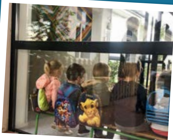
Bonne rentrée !