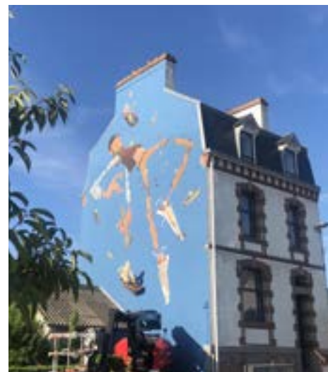
9 rue des écoles - Auteur : Maye