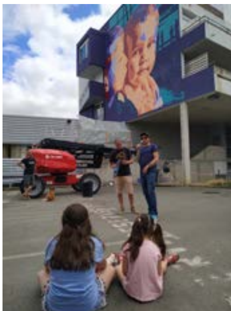
5 rue des Grèves - Auteur: Hektor