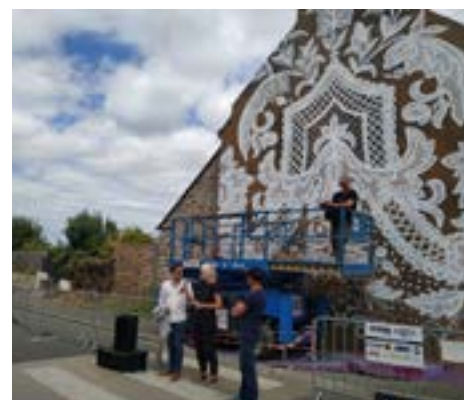
43 rue du Gal de Gaulle - Auteur : Nespoon