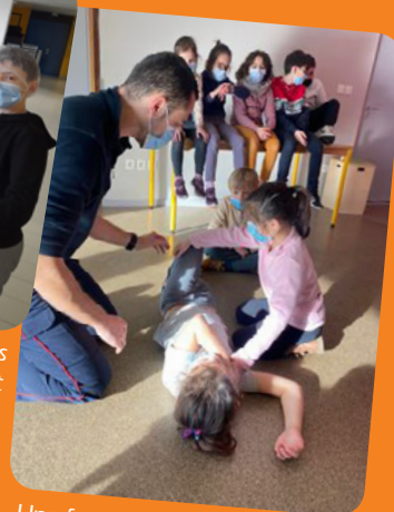
Une formation aux gestes de 1 ers secours était au programme des vacances. Une ambiance studieuse et conviviale.