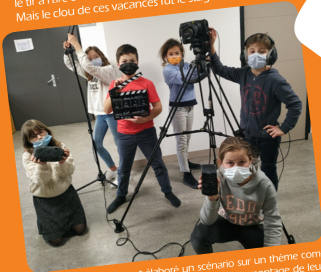
A Yffiniac, les enfants ont élaboré un scénario sur un thème commun aux 6 communes « Ensemble ». Tournage, montage de leur film qui sera ensuite présenté le 14 mai au Grand Pré à Langueux.

Durant les vacances de février, les loisirs ont battu leur plein aussi bien du côté de l'accueil de loisirs à la Croix-Bertrand que du côté de l'Antrejeunes. Entre le grand jeu Captain America et Batman, la fabrication de délicieuses pâtisseries, le tir à l'arc et la sarbacane, le panel des possibles était fait pour tous les goûts. Mais le clou de ces vacances fut le stage de pocket film.