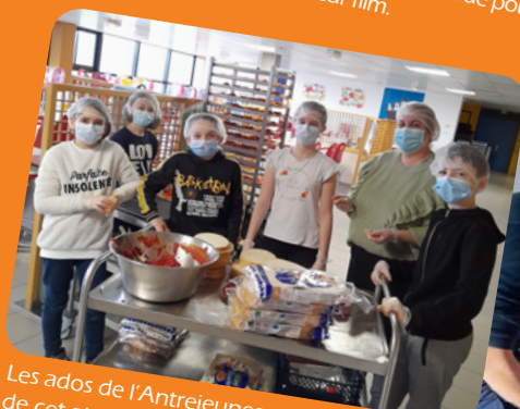
Les ados de l'Antrejeunes se sont régalés lors de cet atelier culinaire où la bruschetta a fait des heureux.