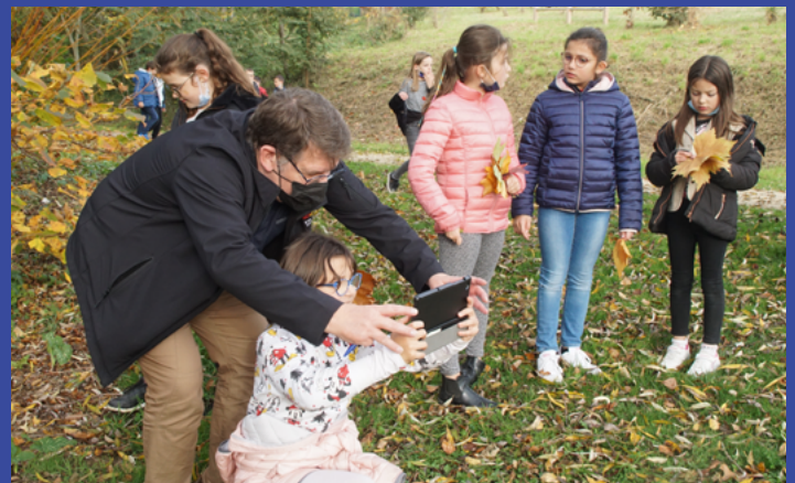
Séance photos de paysage au parc Au fil de l'eau pour les élèves de CE2 de Nelly Rouillé animée par Philippe.

gueusienne, va ainsi permettre l'élaboration des différents travaux programmés, à commencer par la photographie pour les élèves de cycle 2 (CP, CE1, CE2). Ce chantier lancé l'an passé se construira avec deux photographes, Françoise et Philippe. A l'aide d'une tablette, ils vont découvrir la photo déclinée en trois thèmes : le portrait, le paysage et l'architecture. Ensuite, les CM1/CM2 participeront à plusieurs ateliers sur la poésie. Ils expérimenteront l'écriture poétique avec pour objectif la création de textes présentant les photos sélectionnées (près de 90). Quant aux maternelles, ils vont s'essayer à la peinture pour créer des œuvres qui viendront en complément des photos. Nous vous tiendrons au courant de l'avancée de ce projet.