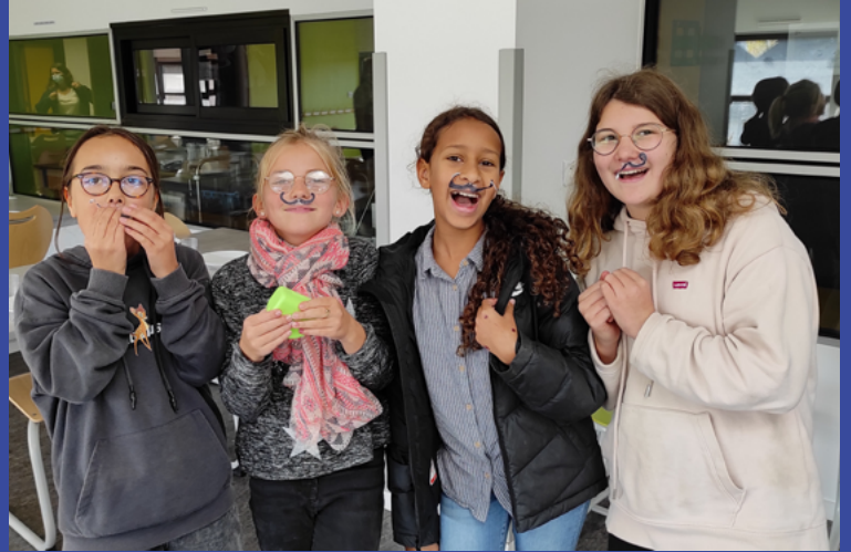
Sur la photo : un groupe de CM2 de l'école Simone Veil a créé de sa propre initiative, des accessoires moustaches « mexicaines » pour le repas à thème du 22 octobre.

Ce groupe de travail a défini différents axes d'amélioration, valorisant les compétences des enfants tout en faisant progresser leur comportement lors des repas. Il existe une volonté globale de la municipalité d'améliorer la qualité de la restauration scolaire : plus de frais, de bio, de local,...tout en la rendant accessible à tous, notamment grâce à l'instauration des repas à 1€. « Depuis la rentrée 2021, avec l'arrivée de nouvelles recettes réalisées par nos équipes en cuisine, nous proposons davantage de produits frais travaillés et de plats « faits maison » : salade de cocos paimpolais, bœuf niçois, panna cotta, parmentier à la citrouille, bœuf Stroganoff, etc », explique Virginie Courteau la responsable du service. Oui plus est, un à deux repas à thème sont organisés chaque mois (breton, indien, mexicain, italien ou encore asiatique), l'occasion de découvrir d'autres saveurs, de favoriser l'éveil au goût et d'explorer d'autres habitudes alimentaires.