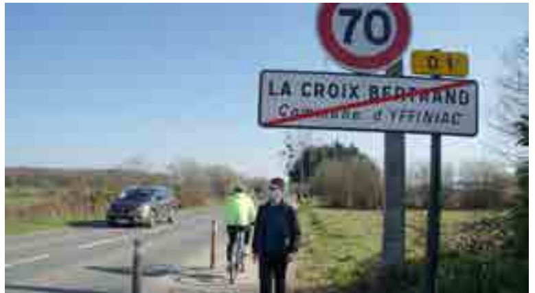
Des subventions ont été accordées par l'agglomération pour la réalisation des pistes cyclables.