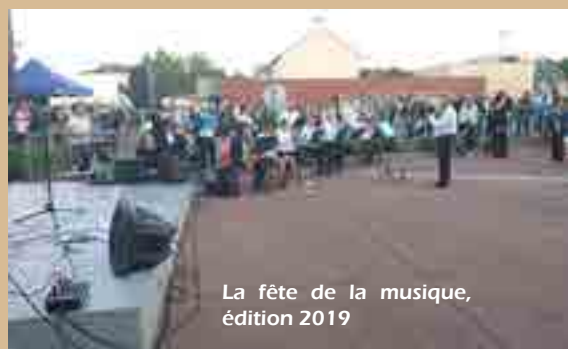
La fête de la musique, édition 2019

ainsi qu'aux associations yffiniacaises qui souhaiteraient participer, bénévolement, à cet événement. Inscriptions avant le 16 mai à adjoint-culture@ville-yffiniac.fr ou au 02 96 72 74 27 (Médiathèque).