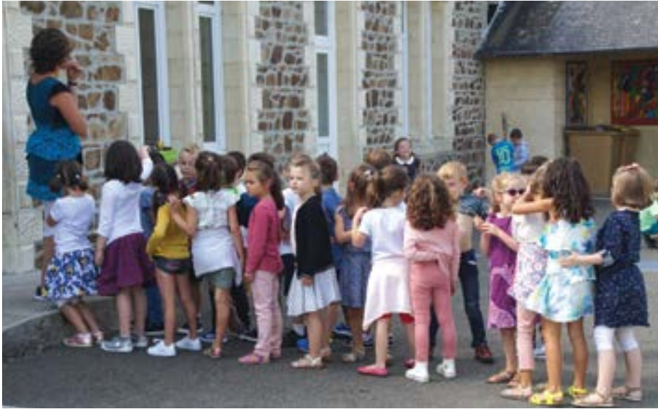
La cloche a sonné ! Les élèves attendent patiemment de rentrer en classe pour cette dernière partie de journée.

222 enfants dont 85 en maternelle répartis en 9 classes