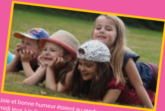
Joie et bonne humeur étaient au rendez-vous lors d'un après-midi jeux à la Croix-Bertrand.