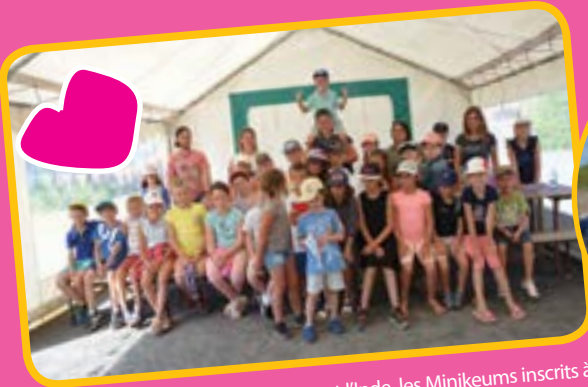
Entre l'Italie, l'Espagne, le Mexique et l'Inde, les Minikeums inscrits à Coat Erbeau ont découvert ces 4 pays à travers différentes activités.

Toutes les bonnes choses ont une fin. Les deux mois qui viennent de s'achever auront certainement laissé de beaux souvenirs aux enfants. Les accueils de loisirs et l'Antrejeunes ont tourné à plein régime, avec une moyenne de 35 enfants par jour en juillet et 40 en août avec des pics à 70. Vif succès du côté des mini-camps également qui ont affiché carton plein.