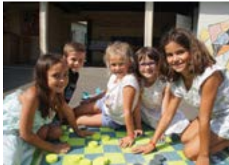
Sous un soleil radieux, petits et grands investissent la cour de récréation. Premier jour d'école et premiers jeux avant de retourner en classe.