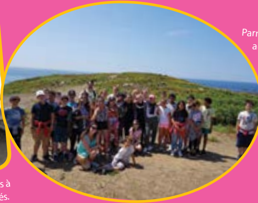
Parmi les sorties proposées aux ados de l'Antrejeunes, la journée croisière autour des 7 îles, à la découverte des oiseaux.