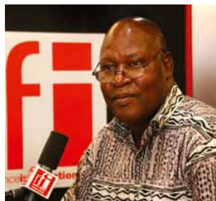
Le Patio (Salle L'Escapade) - Entrée libre