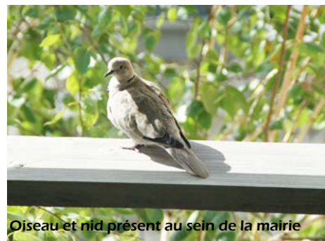
Oiseau et nid présent au sein de la mairie

En octobre, était également organisé la Fête des oiseaux migrateurs. Si vous vous intéressez aux oiseaux en général, en plus des activités, ce rendez-vous animalier permet d'observer les oiseaux dans la Baie de Saint-Brieuc, notamment à la Maison de la Baie.