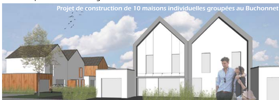
Projet de construction de 10 maisons individuelles groupées au Buchonnet

Selon la nature des travaux, il peut s'agir d'une simple déclaration préalable ou d'un permis de construire. Plus d'information sur le site internet/rubrique urbanisme.