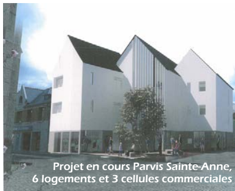
Projet en cours Parvis Sainte-Anne, 6 logements et 3 cellules commerciales

- Le projet de Côtes d'Armor Habitat à l'angle des rues Monseigneur Le Mée et de Penthièvre. Il concerne une réhabilitation du bâtiment existant par la création de 5 logements locatifs sociaux.