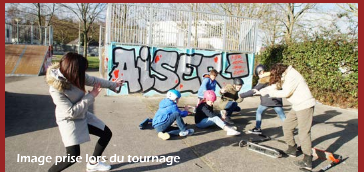
Image prise lors du tournage