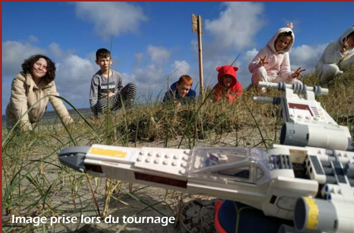
Image prise lors du tournage