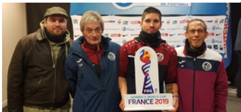
Samedi 9 février - C'est une superbe récompense qu'a reçu l'école de foot : le trophée du challenge qualité foot 2017/2018. Cette distinction a été remise au club pour ses résultats, son travail et son investissement.