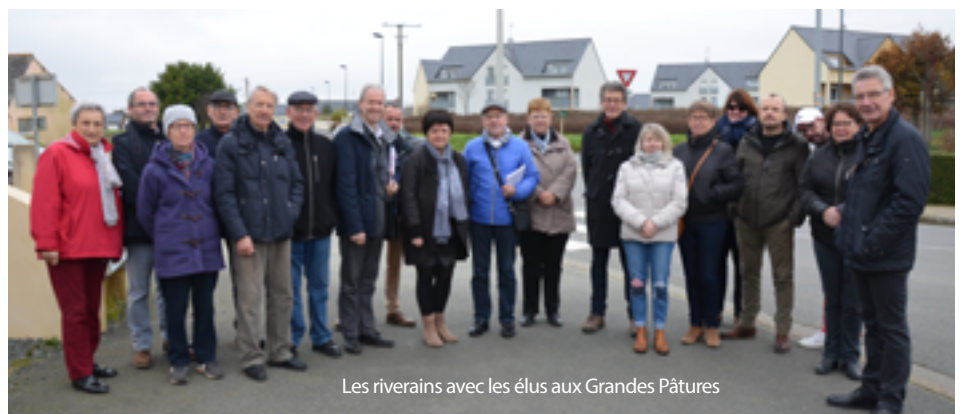
Les riverains avec les élus aux Grandes Pâtures

→ Prochaine réunion de quartier samedi 9 mars : quartier Les Jearnottes et Le Dernier Sou. Rendez-vous au cimetière paysager à 10h30.