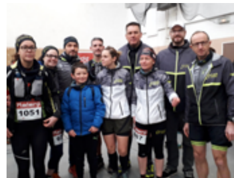
Quelques membres des Trailers d'Armor

→ Randonnée pédestre (départ à 8h30 à 9h45) - Tarif 4 € et gratuit pour les - 12 ans Inscription au : 06 30 80 27 17 (Traîne-Savates)