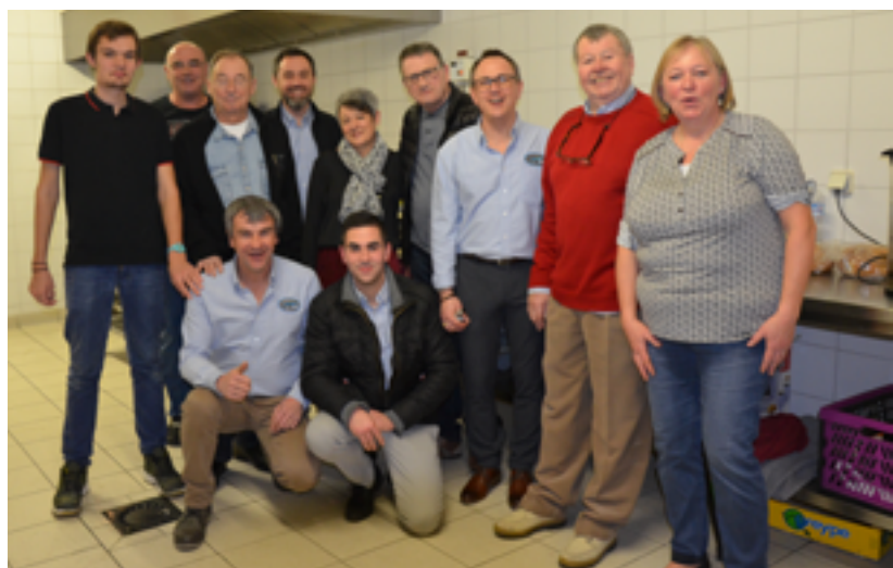
Samedi 9 février - Les Mordus de l'auto aiment également se retrouver pour partager des moments conviviaux comme celui organisé autour de la tartiflette où près de 90 personnes ont répondu présentes. De bon matin, quelques bénévoles se sont lancés aux fourneaux pour les préparatifs.