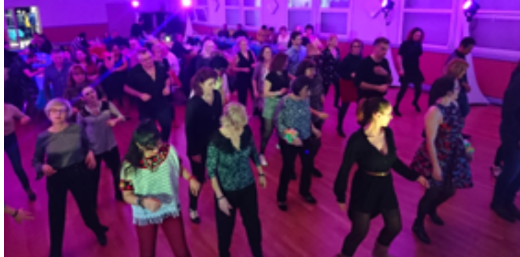
Samedi 9 février - Gros succès au dîner dansant antillais proposé par Carib'Son où les Yffiniacais(e)s ont pu (re)découvrir l'ambiance des îles. Au programme, zouk, biguine, salsa... assaisonnés d'un repas typiquement antillais.