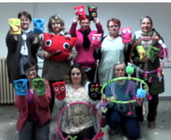
En plus de proposer des ateliers théâtres, éveil musical, contes tout au long de l'année, l'association Assmat'bulles s'est lancée dans la création d'objets à base de matériaux de récupération qui seront utilisés lors de la fête de la musique ou le carnaval.