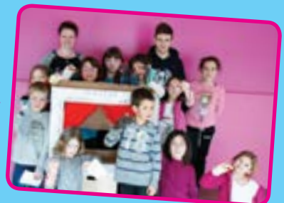
Ainsi font font font... les plus jeunes ont découvert la magie des marionnettes avec au programme fabrication de figurines et mise en scène de leurs personnages.