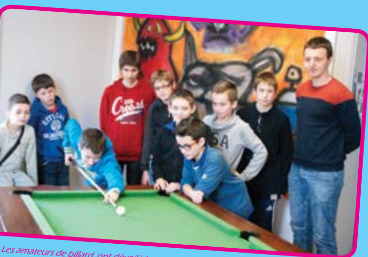
Les amateurs de billard ont dévoilé leur talent sur le tapis vert lors du tournoi... sans perdre la boule.

« C'est génial mais ça passe trop vite », c'est le commentaire général qu'ont fait les enfants pour les deux semaines de vacances d'hiver. Il est vrai qu'avec toutes les activités proposées, pas question de s'ennuyer... bien au contraire.