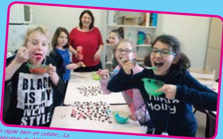
Ca rigole bien en cuisine... La fabrication de M&M'S lors de cet atelier culinaire a mis papi-pilles et zygomatiques en éveil.