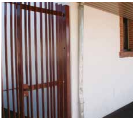
Une descente de gouttière à l'arrière du Patio a été endommagée.