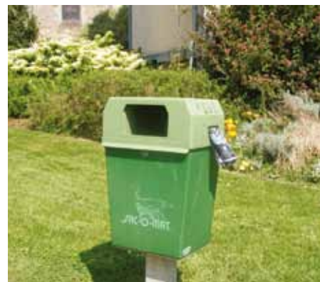
Un distributeur de sacs pour déjections canines se trouve au parc du Millénaire (face à la mairie)

D'autres exemples d'incivilités sont à noter comme le bruit, il figure également parmi les nuisances principales ressentie dans la vie quotidienne ou le brûlage des déchets verts qui peut être à l'origine des troubles de voisinage générés par les odeurs et la fumée.