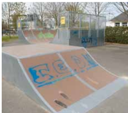
Le skatepark a été tagué et l'une des pistes abîmée par un deux-roues motorisé.

Malgré des appels réguliers au civisme, les incivilités continuent. Si elles sont l'oeuvre de quelques individus, elles ont souvent des conséquences sur l'ensemble des Yffiniacais et ont un coût pour la collectivité. Récemment, de nouveaux actes malveillants de plusieurs sortes ont été constatés : dégradation du mobilier urbain et de bâtiments communaux, dispersion de mégots, déjections canines, etc.