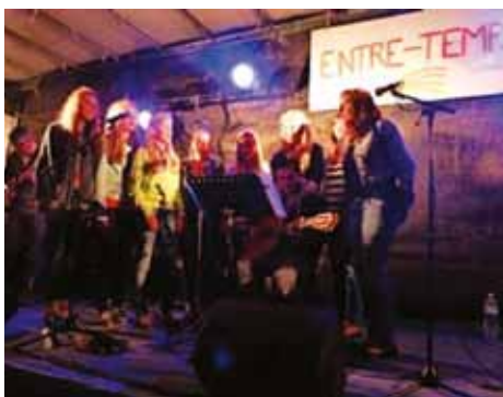
Scène ouverte en 2013

L'Echo de la Baie reçoit la batterie-fanfare de Combloux du 14 au 16 mai. A cette occasion, une aubade sera donnée devant sur le parvis de la mairie. Les deux formations joueront plusieurs morceaux. Venez nombreux !