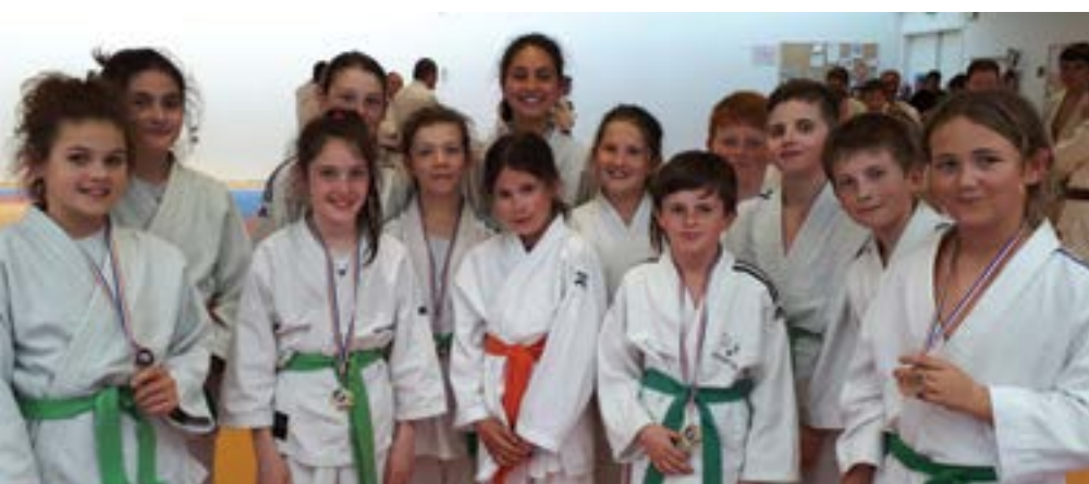
Dimanche 13 mai - Les judokas du club d'Yffiniac ont une nouvelle fois fait preuve de puissance et de technique lors du championnat départemental benjamins et ont obtenu ainsi leurs billets pour le régional.