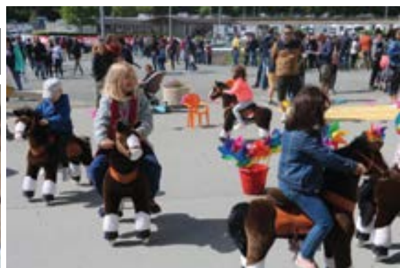
Judi 10 mai - Belle affluence à l'occasion de la Fête des Courses à l'hippodrome où les enfants ont pu profiter des différentes animations dont les poneys mécaniques.