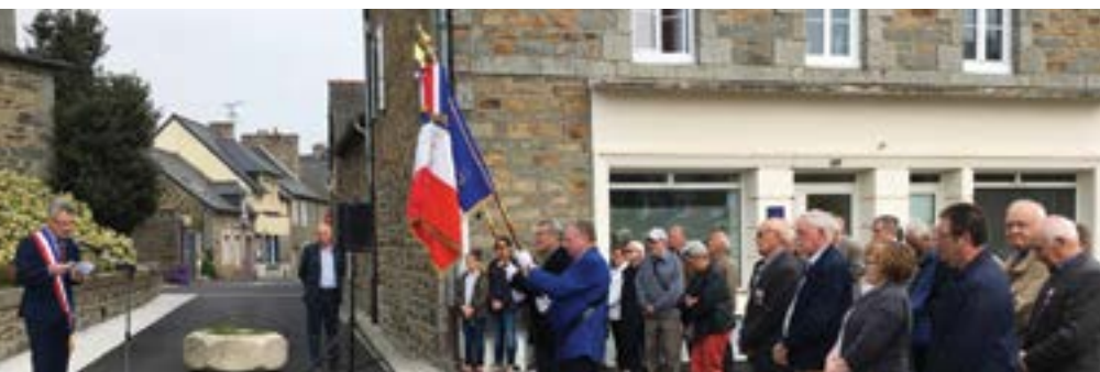
Mardi 8 mai - Le 73 e anniversaire de la victoire du 8 mai 1945 a été célébré en présence de la municipalité, des anciens combattants et d'habitants.