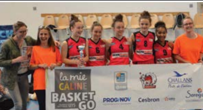
Mardi 8 mai 12 e édition du tournoi de basket de la Mie Caline avec la qualification de la CTC filles (Collaboration entre Clubs) aux finales nationales.