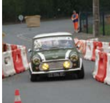
Dimanche 29 avril - Un plateau de premier choix pour le gymkhana des Mordus de l'Auto. Un rendez-vous qui a séduit autant les participants que le public.