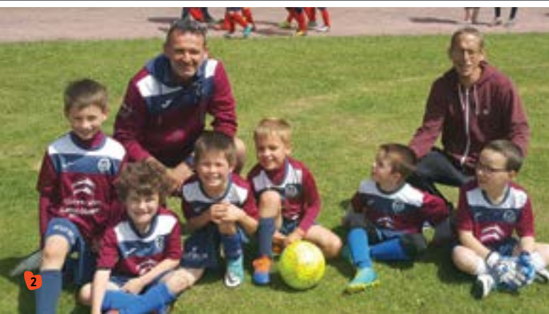
Judi 10 mai Belle performance pour les U7 lors du challenge de Languieux puisqu'ils ont remporté huit matchs sur douze.