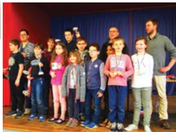
Mardi 1 er mai - 11 e tournoi de parties rapides d'échecs auquel ont participé des joueurs venus des quatre coins de Bretagne.