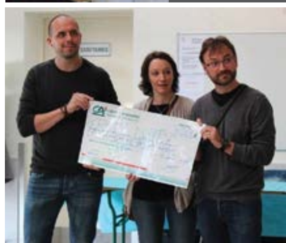
Samedi 5 mai - Suite au vide-grenier de l'Anse Solidaire, deux chèques de 1500 € ont été remis à deux associations caritatives : Pour Maël et Tournicoti Tournicoton.