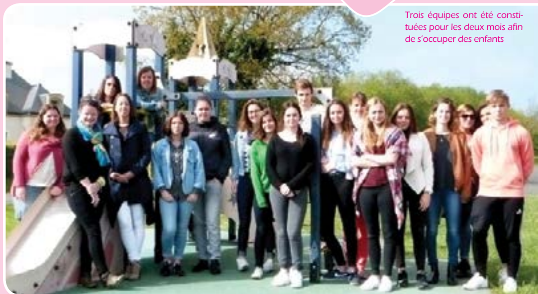
Trois équipes ont été constituées pour les deux mois afin de s'occuper des enfants

Le dossier et la fiche d'inscription sont téléchargeables sur le site de la mairie et