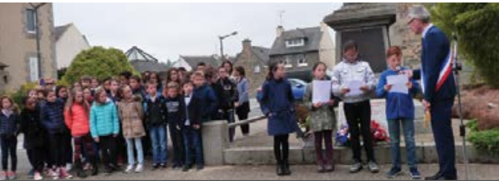
Lundi 8 Mai, une quarantaine d'écoliers a participé à la cérémonie de commémoration du jour de la Victoire, ils ont chanté et lu des textes du jour de la victoire.