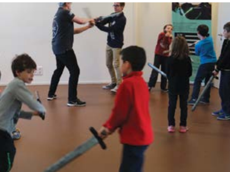
Les amateurs de Star Wars se sont réunis autour du tournoi de sabre laser organisé dans le cadre du mois numérique des médiathèques de la Baie.