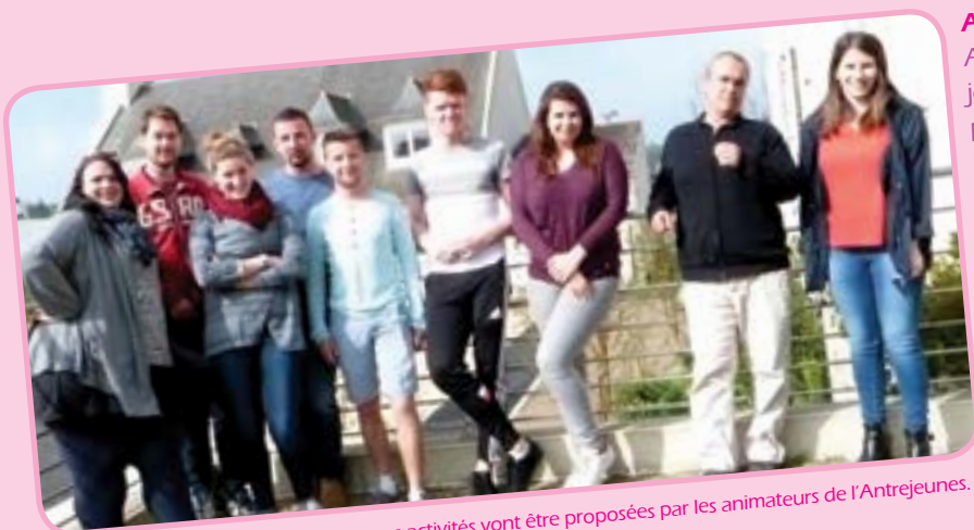
De nombreuses activités vont être proposées par les animateurs de l'Antrejeunes.

disponibles en mairie et à la garderie. Les inscriptions se feront désormais à la journée avec un minimum de deux jours par semaine (au lieu de cinq jours), le programme sera diffusé à partir du 6 juin.