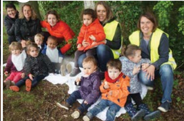
Un pique-nique pluvieux mais joyeux pour les enfants de la Maison de la Petite Enfance qui ont dû trouver refuge sous les arbres du parc Au fil de l'eau.