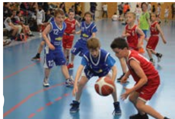
Gros succès à la fête du mini-basket à laquelle ont participé pas moins de 200 joueur(se)s.