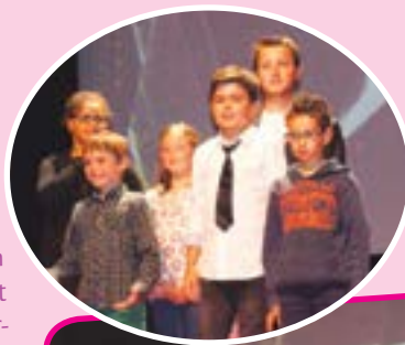
Sur la scène de la salle Roger-Ollivier à Plérin, le groupe des ados et des 6-11 ans sont venus présenter leur court-métrage.

Encadrés principalement par Nicolas Guillou réalisateur professionnel, les jeunes découvrent le cinéma devant et derrière la caméra, endossant à la fois le rôle d'acteur et de réalisateur. Une belle occasion de s'initier au 7 e art.