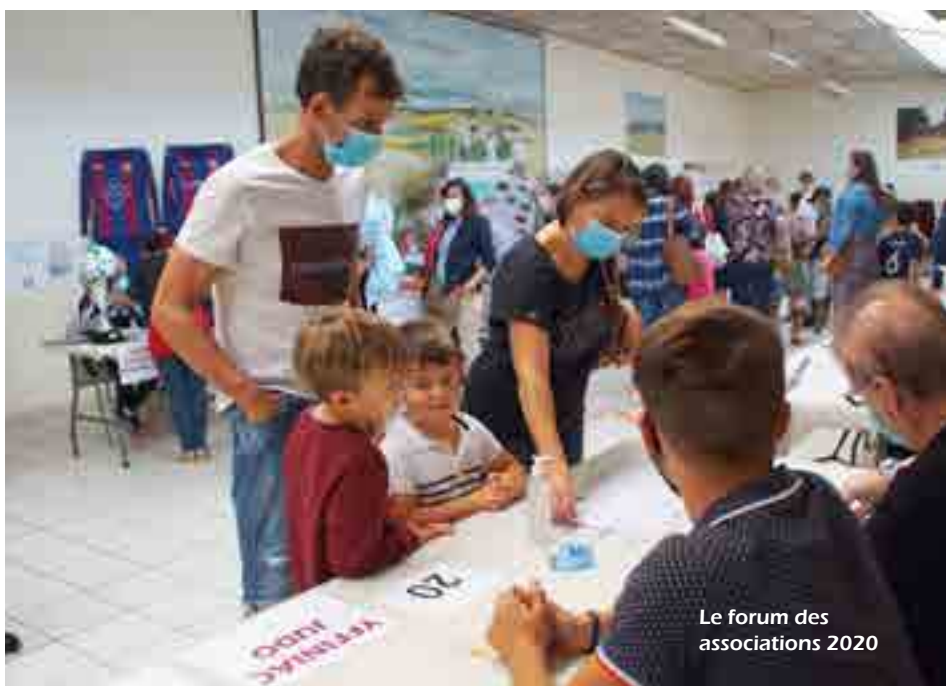
Le forum des associations 2020

Sport, culture, engagement caritatif, pratique musicale ou culturelle, il y en aura pour tous les goûts. Dans le contexte sanitaire, l'organisation sera identique à celle de l'année précédente avec un parcours fléché pour éviter les croisements.