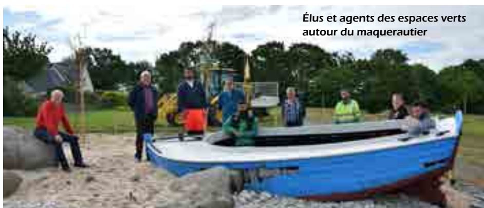
Élus et agents des espaces verts autour du maquereautier

Chaque jour, vous les rencontrez dans l'exercice de leurs fonctions. Ce sont les agents des espaces verts, qui travaillent afin d'améliorer le cadre de vie des Yffiniacais. Outre l'entretien des massifs, l'élagage et la taille des arbres, la tonte des pelouses, le débroussaillage, le fleurissement, ils mettent leur créativité à l'œuvre pour embellir le territoire de la commune.