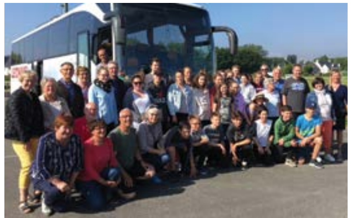
Dimanche 27 mai, arrivée des 25 jeunes Bavaois pour un séjour d'une semaine en Bretagne.