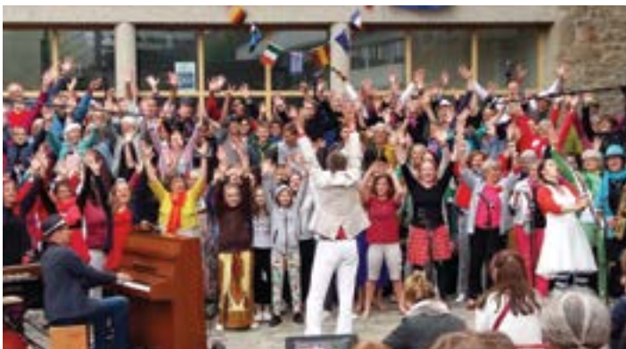
Dans le cadre de la fête de l'Europe, les jeunes allemands ont assisté dans la cour du Conseil départemental au concert du groupe Couleur Jazz et à la formation allemande Chit-Chat Company.