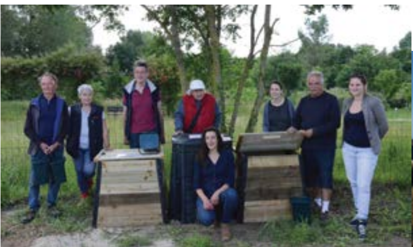
Vendredi 15 juin - Deux composteurs ont été livrés aux jardins partagés du parc Au fil de l'eau, ils permettront ainsi de réduire le volume des déchets.