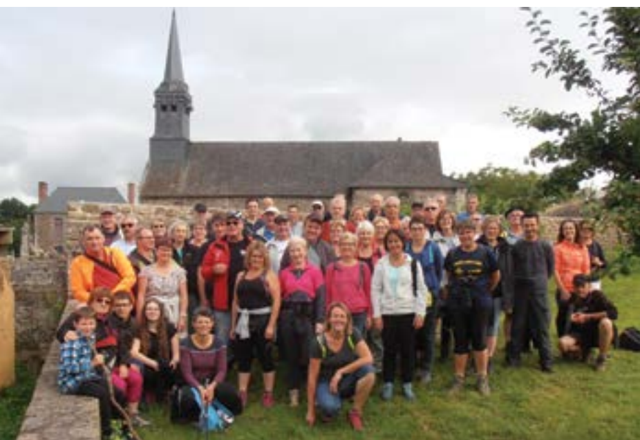
Dimanche 17 juin - Une journée fort sympathique pour les randonneurs des Traines-Savates avec au programme, une marche de 10 km le matin suivie d'un pique-nique. L'après-midi, nouvelle balade du côté du canal d'Ille et Rance autour du festival Jazz aux Ecluses.