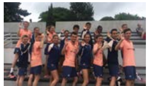
L'équipe des ramasseurs bretons