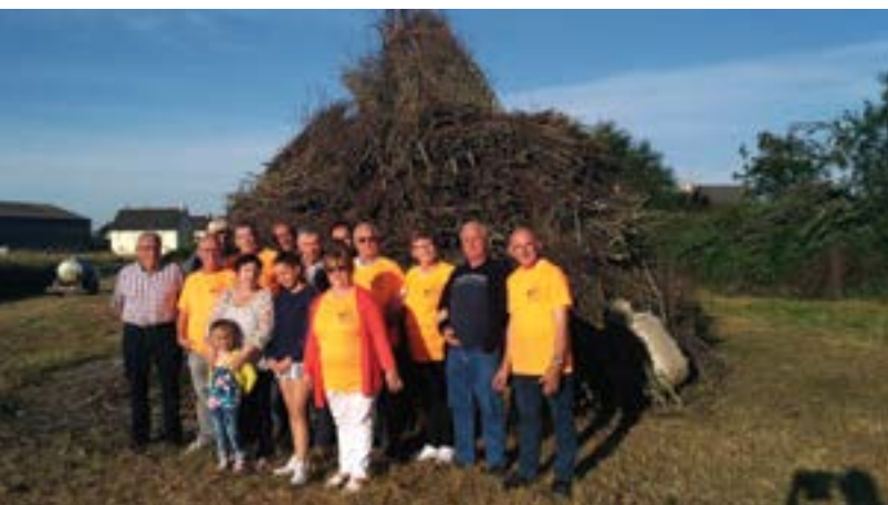
Samedi 23 juin - La fouée de la Saint-Jean du Comité de la gare a une nouvelle fois brillé et les membres de l'association ont tout mis en oeuvre pour réussir une journée ponctuée par la marche des 10 km l'après-midi et du jambon à l'os le soir.