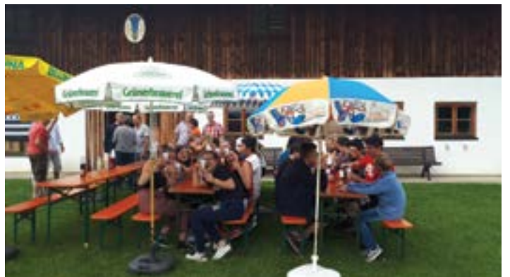
Arrivée des Bretons à Haunleiten avec dégustation de gâteaux bavaois accompagnés de jus de fruit, bien appréciés après 20 heures de voyage en car.