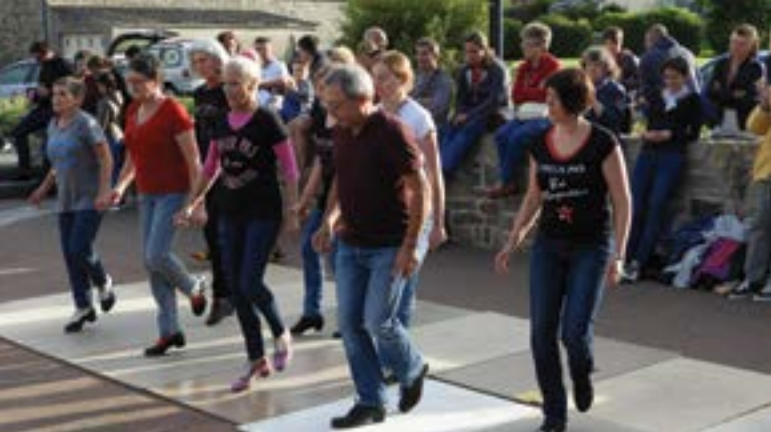
Jeudi 21 juin - Encore une bonne note pour cette nouvelle édition de la fête de la musique à Yffiniac. Le soleil était au rendez-vous et les musiciens, chanteurs et danseurs s'en sont donnés à cœur joie !