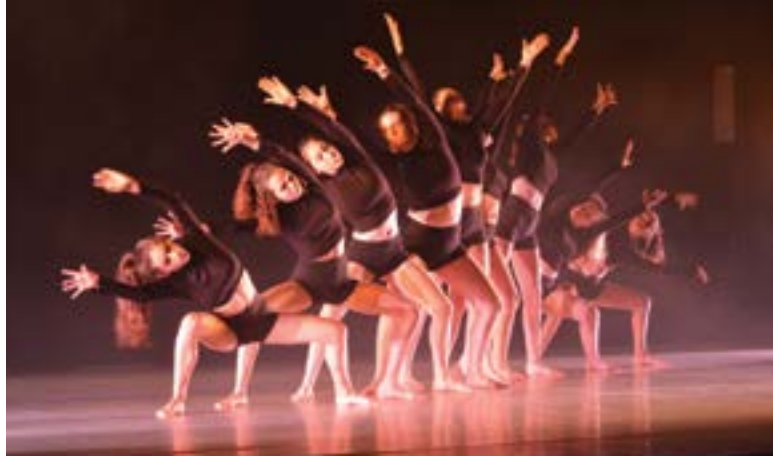
8 et 9 juin - Le gala présenté cette année par Yffi'Danse et intitulé « Une page d'histoire » a conquis le public. Les artistes ont dansé sur des grands moments de l'Histoire comme la révolution industrielle, la préhistoire, la révolution française, la renaissance, la chute du mur de Berlin...