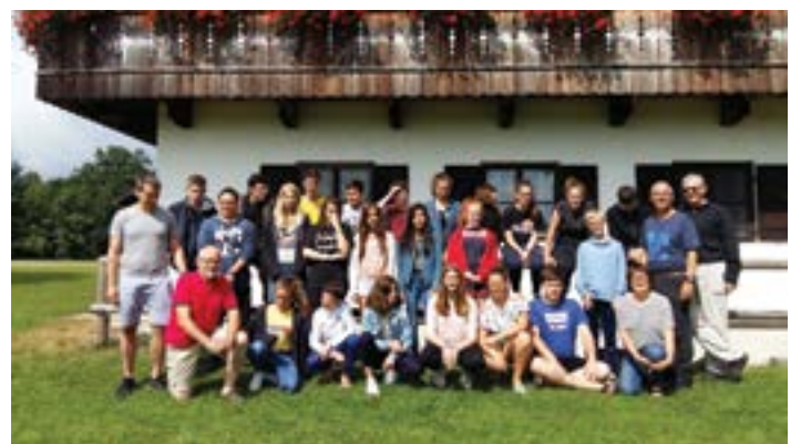
Les jeunes Yffiniacais s'apprêtent à quitter leur lieu de résidence, le chalet d'Haunleiten et à prendre la route du retour pour la Bretagne.