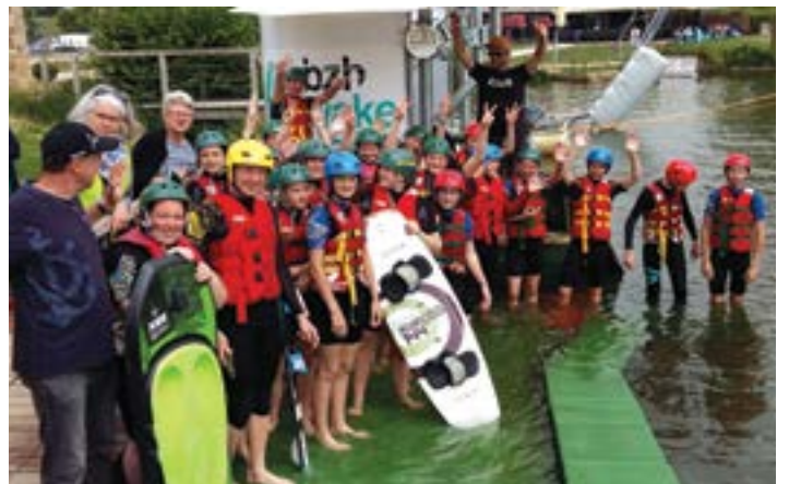
La journée au Wake Park à Dolo a été l'occasion pour les jeunes allemands de s'initier au téléski nautique.