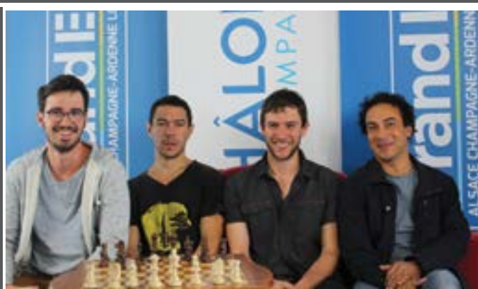
23 et 24 juin - Les joueurs d'Yffiniac du club d'échecs ont réalisé un parcours honorable lors de la Coupe 2000 et termine 8 e sur 14.