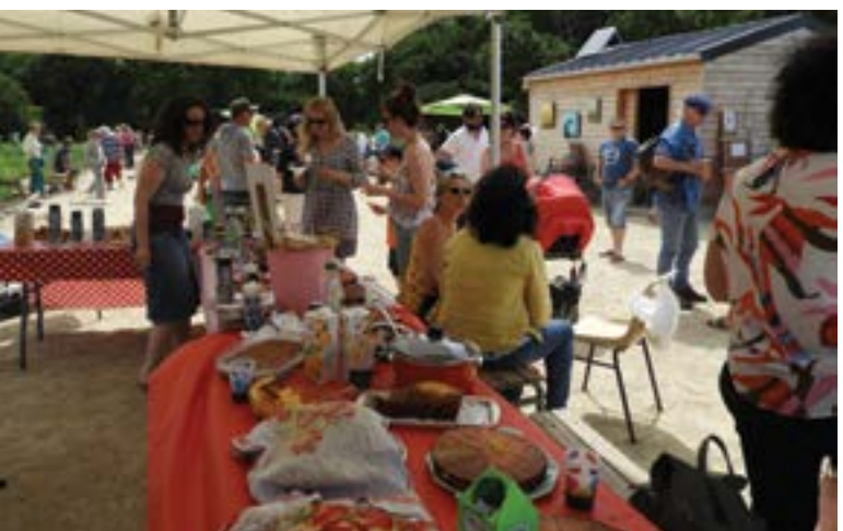
Dimanche 24 juin - Les jardins partagés au parc Au fil de l'eau étaient en fête. Pour cette première, ce fut une réussite totale.