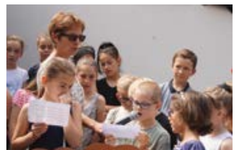
Pour lui rendre hommage, les enfants ont lu des petits textes décrivant cette femme d'exception, considérée comme « la femme politique préférée des Français. »