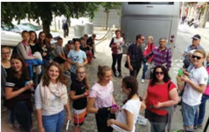
Parmi les sorties organisées, la visite du vieux Dinan, l'incontournable cité médiévale avec le Jerzual qu'il a fallu arpenter.