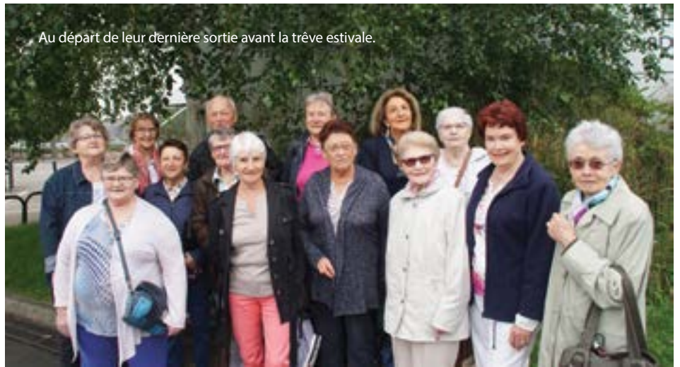
Au départ de leur dernière sortie avant la trêve estivale.

Entre ses rendez-vous hebdomadaires (jeux de cartes, de société, marche, boules), ses repas, ses après-midis dansants et ses sorties, les Amis de la Baie s'activent tout au long de l'année. Avant la trêve estivale, nos aînés ont fait une virée dans la vallée des Saints à Carnoet, en passant par le musée de la Résistance à St-Connan et l'Abbaye Cistercienne.