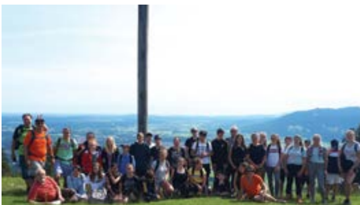
Les montagnes sont au cœur de la culture bavaoise. Ici, photo de famille en haut du mont Blomberg, un sommet très populaire en Bavière.