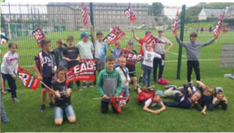
Dimanche 27 mai - Les jeunes de l'école de foot ont eu le privilège d'aller encourager l'équipe féminine de Guingamp qui affrontait Marseille, qui, grâce à ce résultat, est maintenu en D1. Une victoire vivement fêtée sur la pelouse du Roudourou.