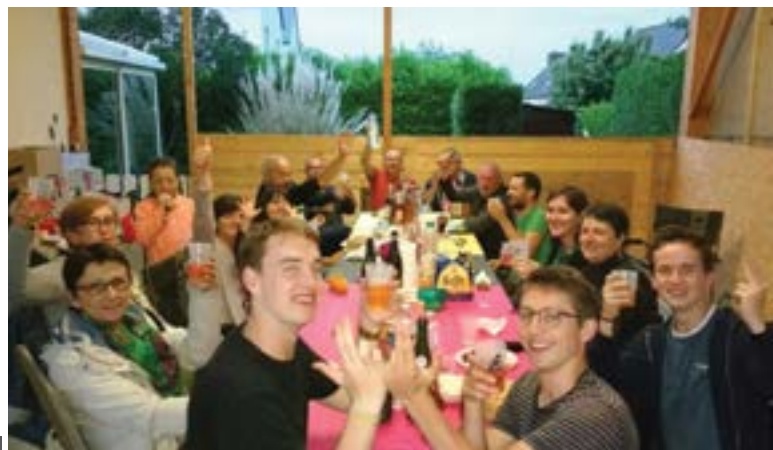
Dimanche 10 juin - Il régnait une belle ambiance à l'occasion du traditionnel repas de quartier des riverains de la rue Paul Cézanne et des environs.