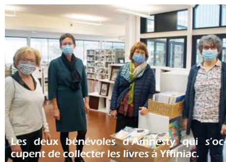
Les deux bénévoles d'Amnesty qui s'occupent de collecter les livres à Yffiniac.