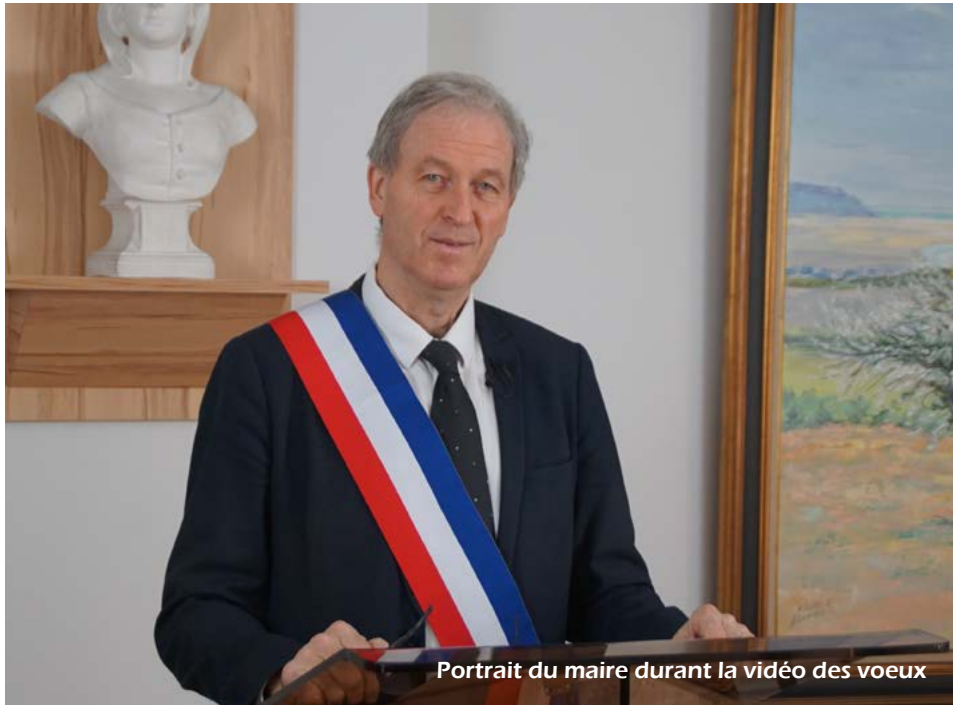
Portrait du maire durant la vidéo des voeux

Il a également salué l'enseignement : « je songe aux écoles et ses encadrants ainsi