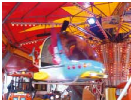
Comme à chaque fois, la fête foraine a réjoui petits et grands.

L'équipe du Comité d'Animation a, comme à l'accoutumée, mis les bouchées doubles pour offrir un programme de choix. Des manèges, des spectacles, du sport, de la convivialité, sans oublier le fameux chocard : tous les ingrédients étaient réunis pour participer à la réussite de cette fête. Organisée conjointement avec la municipalité, la fête des Chocards a une nouvelle fois fédéré.