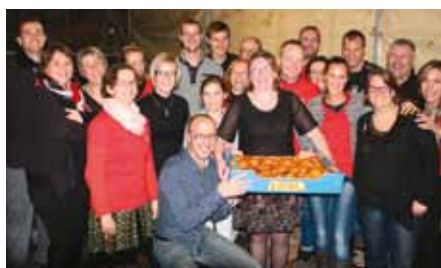
Les bénévoles de l'Amicale Laïque ont innové cette année en proposant au repas des Chocards une entrée tout à fait délicieuse : un velouté de citrouille aux brisures de châtaignes torréfiées.