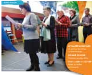
LECTURE À HAUTE VOIX MARDI 26 JANVIER AU PÔLE CULTUREL LE PATIO