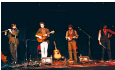
Pour les amateurs du genre ou pas, cette soirée à l'heure irlandaise en compagnie de Poppy Seeds fut une belle découverte.