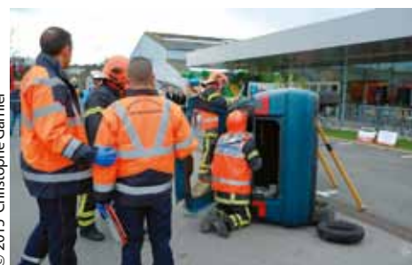
Plusieurs exercices de désincarcération ont été effectués par les pompiers du Perray.

née, l'opération Téléthon prend un peu plus d'ampleur avec une organisation maintenant bien rôdée et une mobilisation non-stop durant plusieurs jours. Ce fut donc une édition placée sous le signe de la générosité et de la diversité. Quelques points forts sont à signaler comme le vide-grenier, le dîner-spectacle dont le service était géré par Carib'son ainsi que les démonstrations des pompiers du Perray.