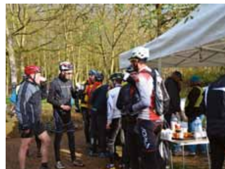
Près de 900 marcheurs et vététistes ont pris le départ de la rando des Chocards. Le ravitaillement prévu par l'Amicale des Cyclos à l'arrivée a été très apprécié !