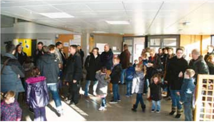
Un dossier sur le restaurant scolaire et son organisation sera consacré dans le Sillon de mars.