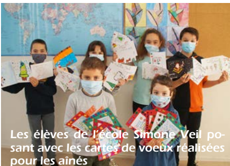
Les élèves de l'école Simone Veil posant avec les cartes de vœux réalisées pour les aînés