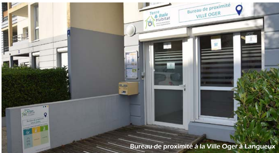
Bureau de proximité à la Ville Oger à Languoux

Toutes les équipes de TBH et les prestataires sont mobilisés et continuent d'assurer leurs missions sur le terrain. Cependant, les interventions à domicile ne peuvent être réalisées qu'après vérification de l'état de santé des locataires via un questionnaire préalable et du respect des règles sanitaires strictes. Le délai de traitement de la demande peut être allongé au vu du contexte.