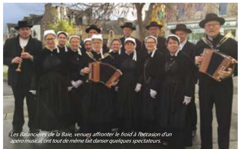
Les Balancières de la Baie, venues affronter le froid à l'occasion d'un apéro musical, ont tout de même fait danser quelques spectateurs.