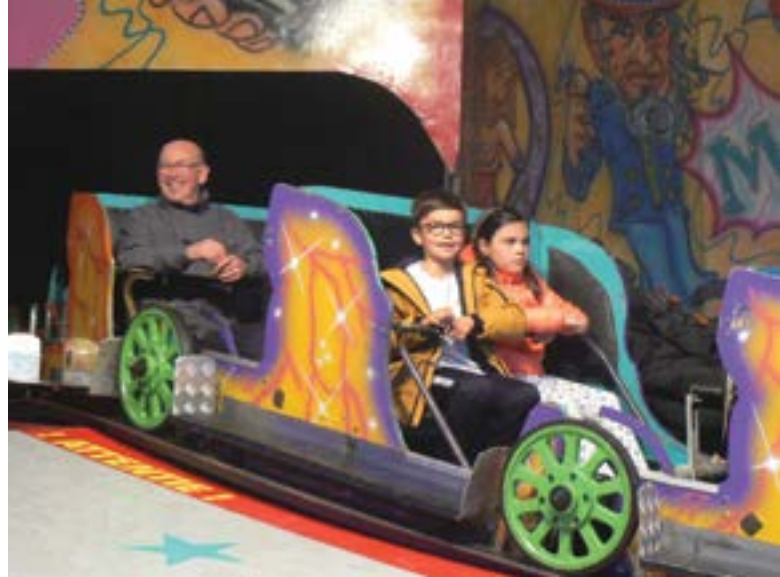
Auto-tamponneuses, chenilles, maison hantée ou tout simplement pêche aux canards, la fête foraine a tout pour plaire aux petits comme aux grands.