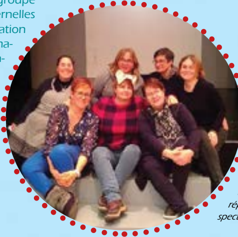
Quelques membres de l'association, lors d'une dernière répétition avant le spectacle.

Spectacle Le Coq Rico Samedi 16 décembre à 16h30 salle du Belvédère - 2€ (1€ sera reversé au Téléthon).