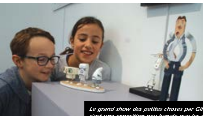
Le grand show des petites choses par Gilbert Legrand : c'est une exposition peu banale que les écoliers ont pu découvrir tout au long du mois de novembre.