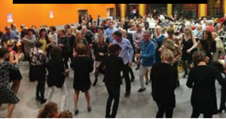
Samedi 4 novembre, l'association Carib'Son a une nouvelle fois enchanté ses convives lors de cette soirée antillaise. Mets créoles dans un décor des îles et une ambiance « caliente ». Prochain grand rendez-vous : le spectacle cabaret les 24 et 25 mars prochain.