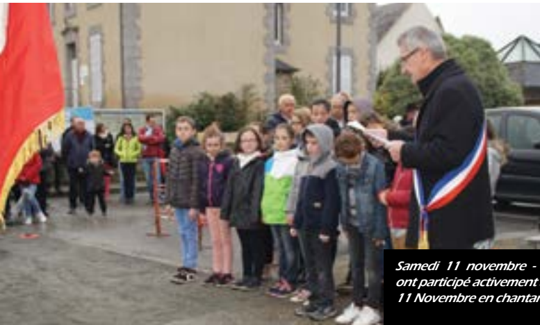
Samedi 11 novembre - Plusieurs écoliers ont participé activement à la cérémonie du 11 Novembre en chantant la Marseillaise.