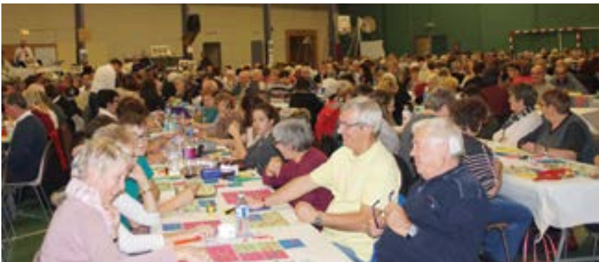
Le grand loto de l'Écho de la Baie est un des rendez-vous importants dans l'année. Une cinquantaine de bénévoles s'activent à la préparation. La recette de la journée sert au financement des professeurs de l'association et à la location d'instruments.