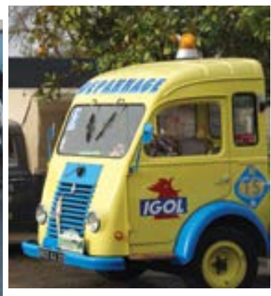
L'exposition des véhicules publicitaires des Mordus de l'Auto a attiré les amateurs.