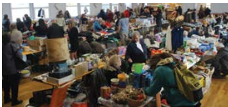
Le vide-grenier des Chocards est un rendez-vous prisé pour les exposants et les chineurs.