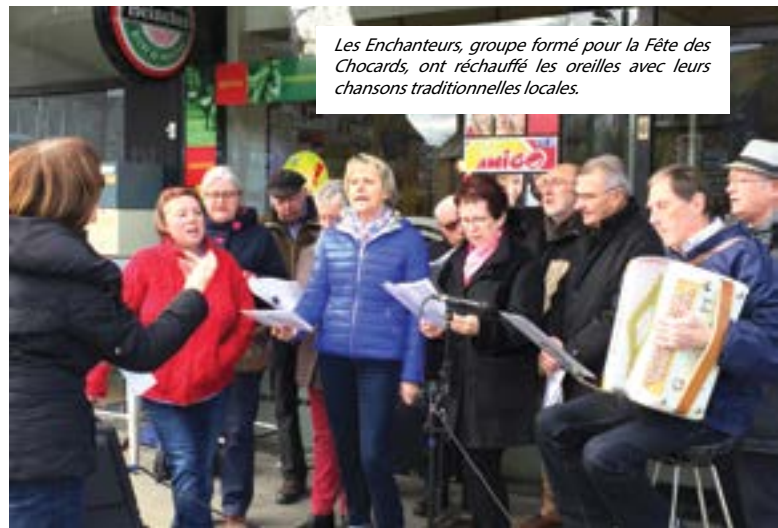
Les Enchanteurs, groupe formé pour la Fête des Chocards, ont réchauffé les oreilles avec leurs chansons traditionnelles locales.