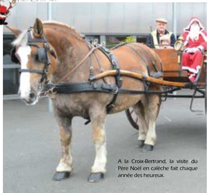
A la Croix-Bertrand, la visite du Père Noël en calèche fait chaque année des heureux.