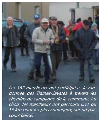
Les 182 marcheurs ont participé à la randonnée des Traînes-Savates à travers les chemins de campagne de la commune. Au choix, les marcheurs ont parcouru 6,11 ou 15 km pour les plus courageux, sur un parcours balisé.