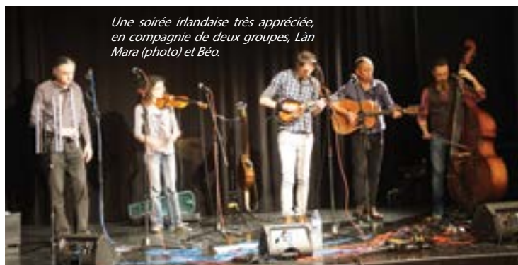
Une soirée irlandaise très appréciée, en compagnie de deux groupes, Làn Mara (photo) et Béo.