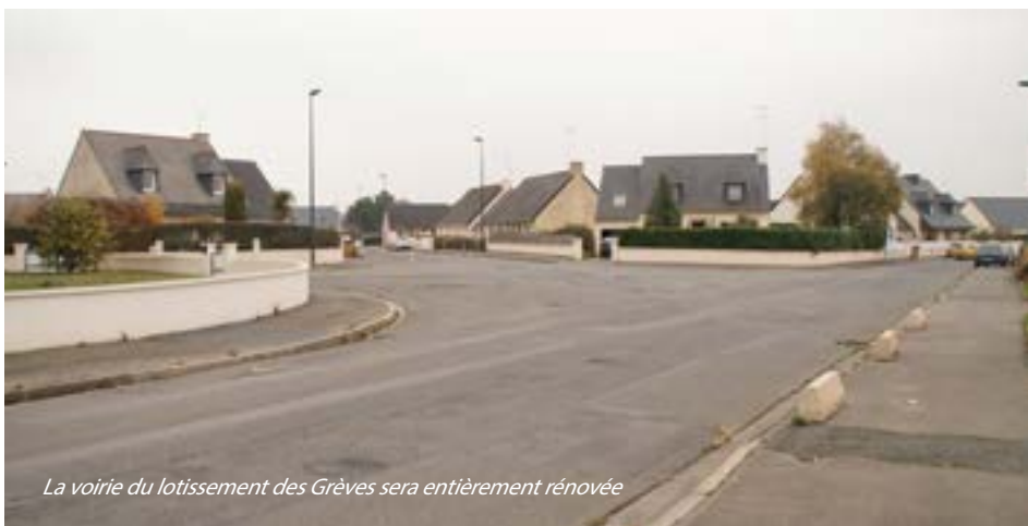
La voirie du lotissement des Grèves sera entièrement rénovée

La voirie de ce lotissement s'est lentement dégradée mais il n'était pas envisageable d'effectuer des travaux avant la réfection totale des réseaux souterrains ; les canalisations d'eau pluviale (dernière partie) seront reprises courant décembre. Les travaux d'aménagement des voiries, effectués en plusieurs tranches se succédant sans interruption, se dérouleront au cours du 1 er semestre 2017. Les modifications principales concerneront les sens de circulation.