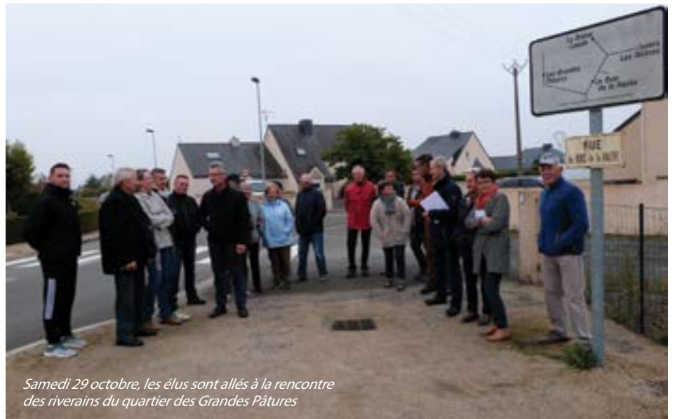
Samedi 29 octobre, les élus sont allés à la rencontre des riverains du quartier des Grandes Pâtures

Concernant l'adéquation du nombre de poubelles, le maire a répondu par une proposition de mise en place de collecteur enterré. Même si cet équipement implique un coût financier, celui-ci pourra s'intégrer avec pertinence au sein du quartier dont l'approche environnementale et urbanistique